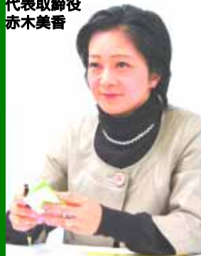
【ファシリテーター】